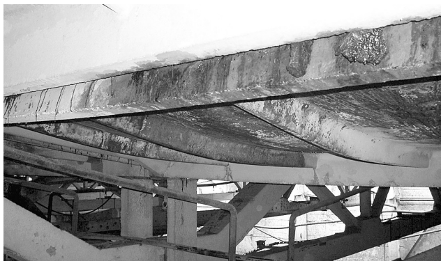
Фото. 1. Общий вид ребристой плиты в составе покрытия после пожара с косвенными признаками разрушения.